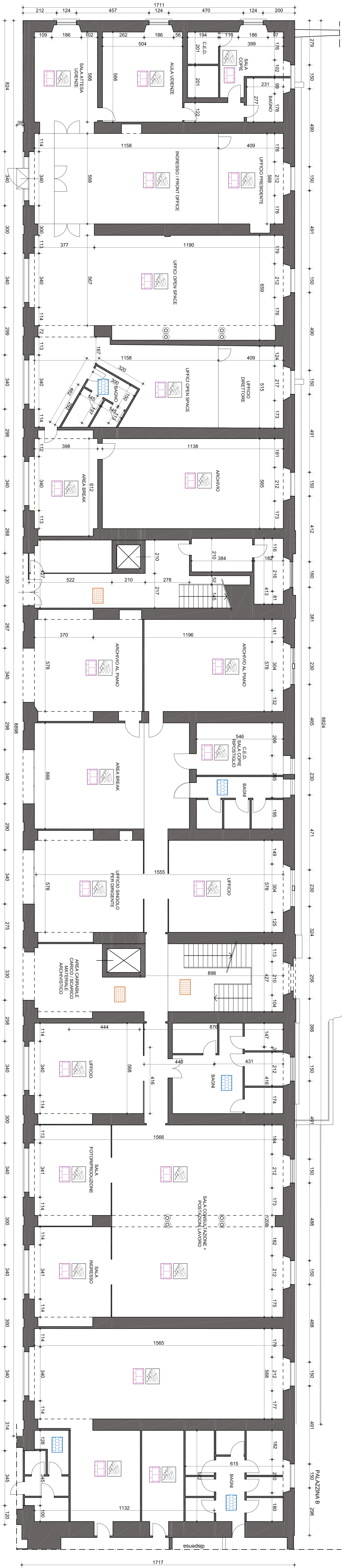
PLANIMETRIA PIANO TERRA