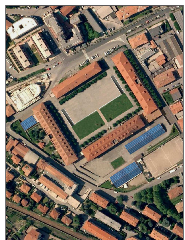
COBO010 - caserma De Cristoforis Como - piazzale Montesanto